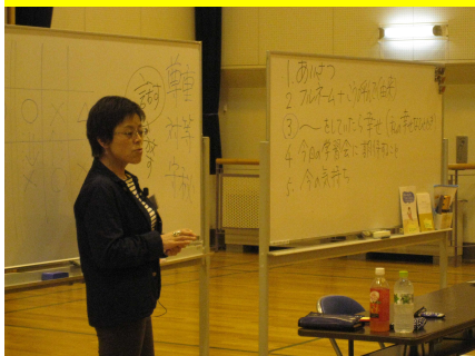
あねたい し 姉帯氏